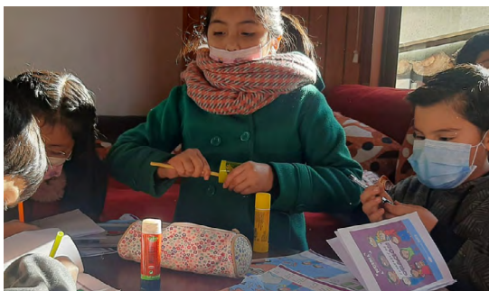
Niños de Osorno - Chile, pintando el pasaporte de la Iglesia Perseguida