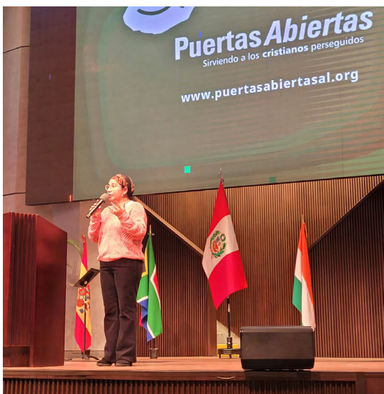
DIP en Iglesia Alianza Cristiana y Misionera de Miraflores, Perú