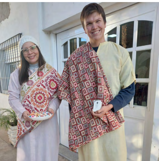
Hermanos de la Iglesia Bautista del Amor, en Argentina

El Domingo de la Iglesia Perseguida (DIP) fue realizado por segunda vez en Latinoamérica.